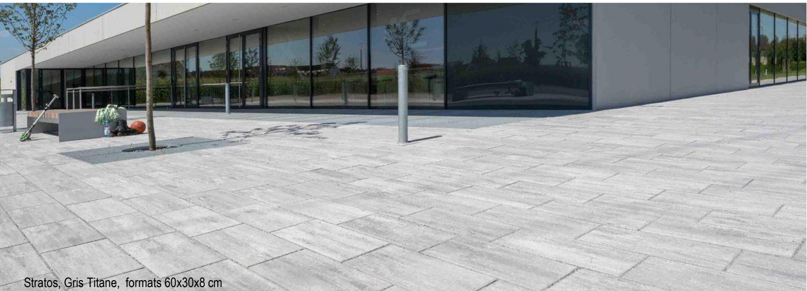
Stratos, Gris Titane, formats 60x30x8 cm