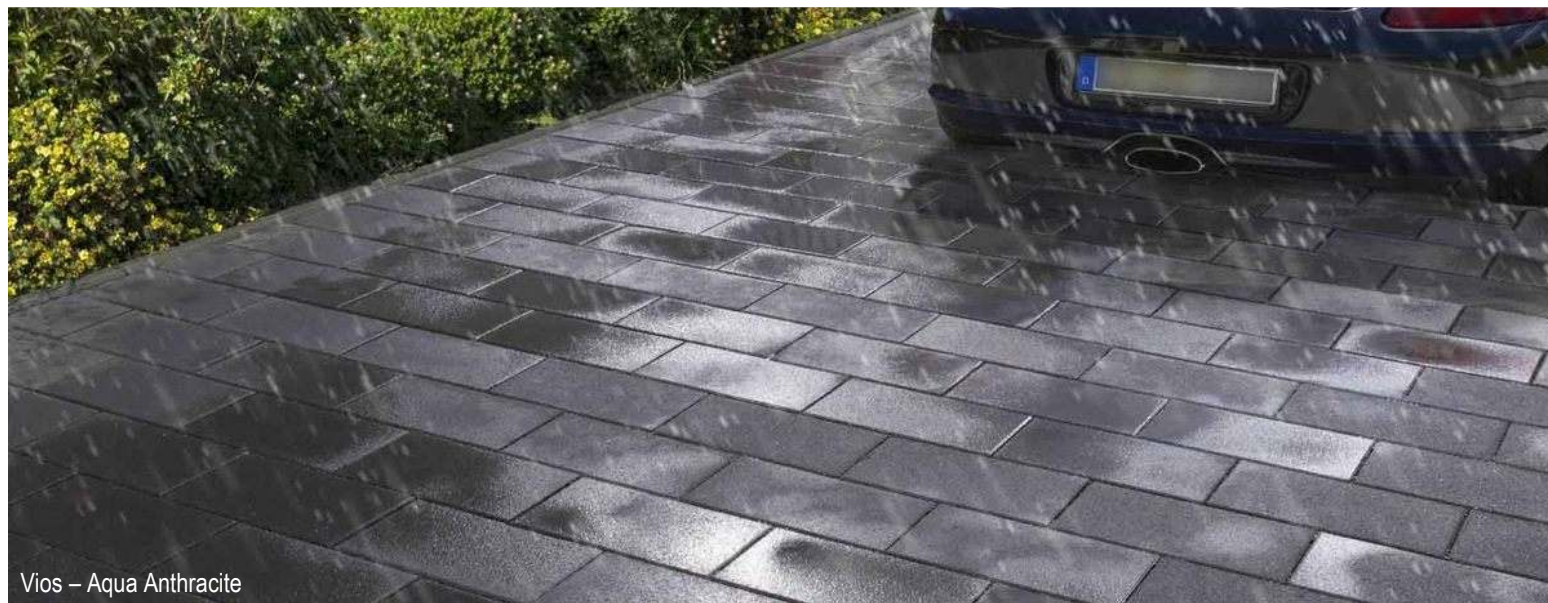
Vios – Aqua Anthracite