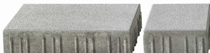
Revêtement grenailé fin – mini-chanfrein 5/2 mm, écarteurs KannTec