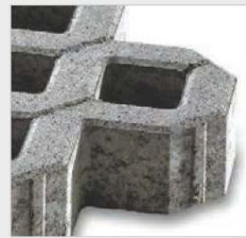
Béton lisse, chanfrein 6x4 mm