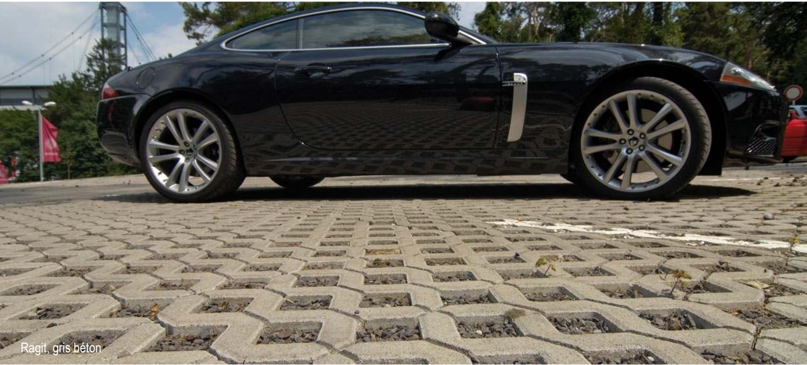
Ragit, gris béton