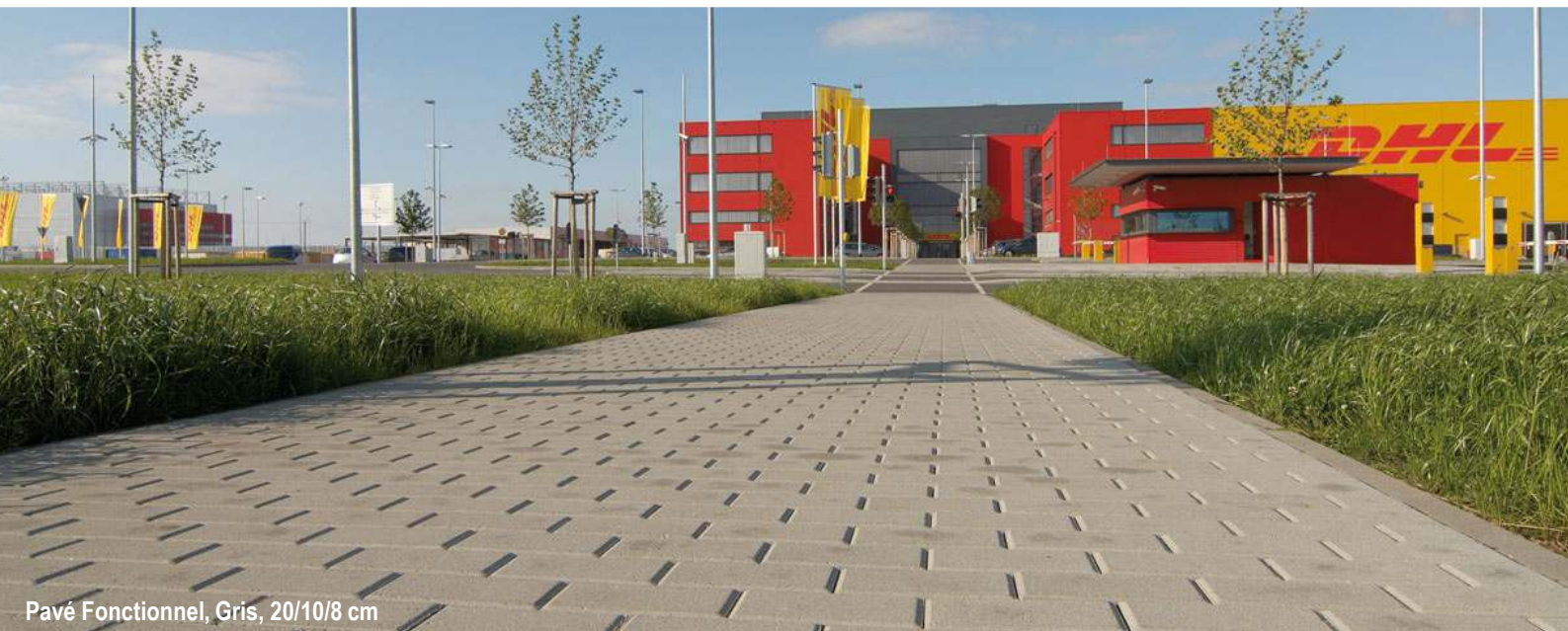
Pavé Fonctionnel, Gris, 20/10/8 cm

Le pavé Fonctionnel est le classique par excellence. Pratique et confortable, il est décliné en de nombreux formats et épaisseurs pour des poses variées.