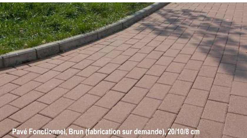
Pavé Fonctionnel, Brun (fabrication sur demande), 20/10/8 cm