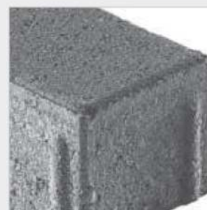
Béton lisse, mini-chanfrein R5/2 mm

Disponible en épaisseur 12 cm sous Pavé MultiTec