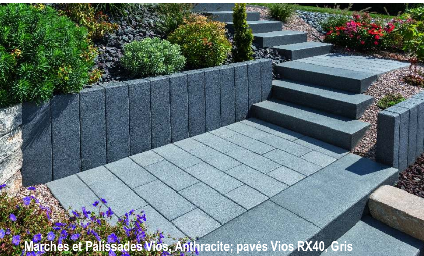
Marches et Palissades Vios, Anthracite; pavés Vios RX40, Gris