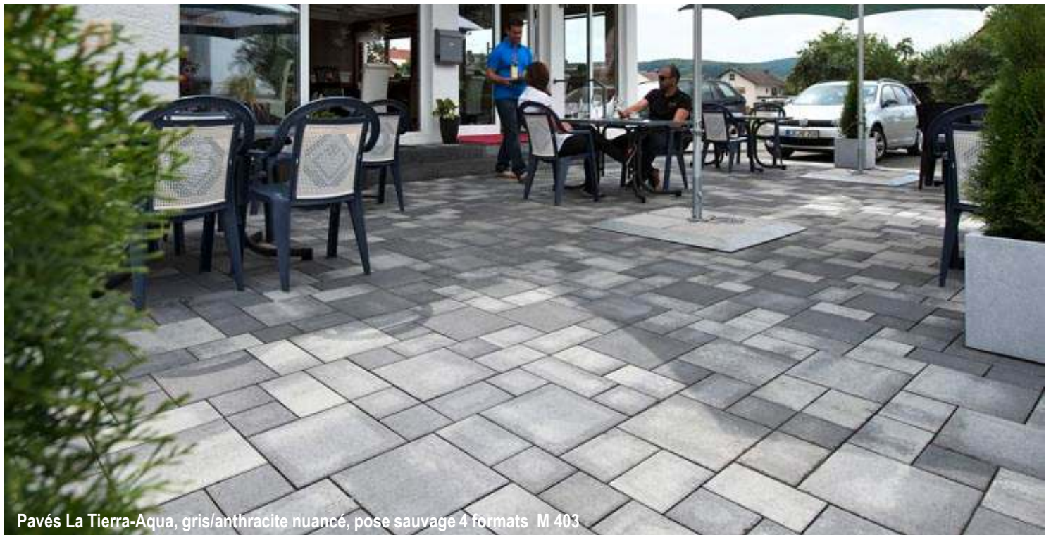
Pavés La Tierra-Aqua, gris/anthracite nuancé, pose sauvage 4 formats M 403

Pavé à double effet : d'une part drainant par ses joints larges de 5 mm et d'autre part avec un rendu esthétique très attractif, La Tierra-Aqua rassemble tous les arguments écologiques et optiques d'un pavé dynamique et intemporel, aux formats naturels et sauvages.