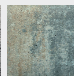
Calcaire coquillier nuancé