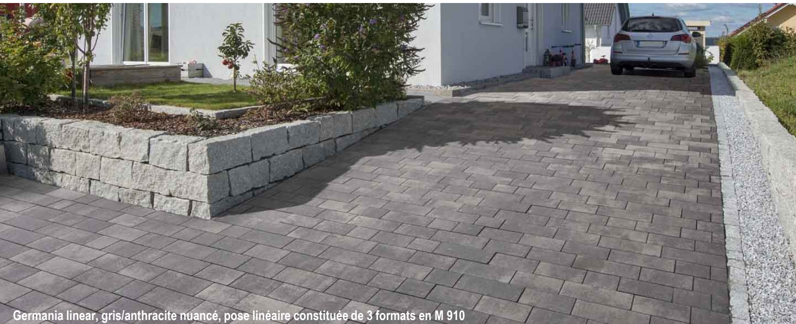
Germania linear, gris/anthracite nuancé, pose linéaire constituée de 3 formats en M 910

Pavé Germania linear, un pavé intemporel aux arêtes vives et à l'aspect béton uni ou nuancé. A la fois pour des espaces contemporains, traditionnels ou fonctionnels. S'utilise également en pavé de rive ou caniveau.