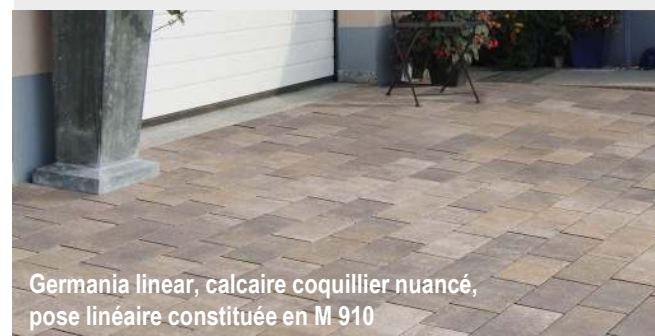
Germania linear, calcaire coquillier nuancé, pose linéaire constituée en M 910