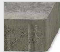
Pavé sans chanfrein, arêtes vives