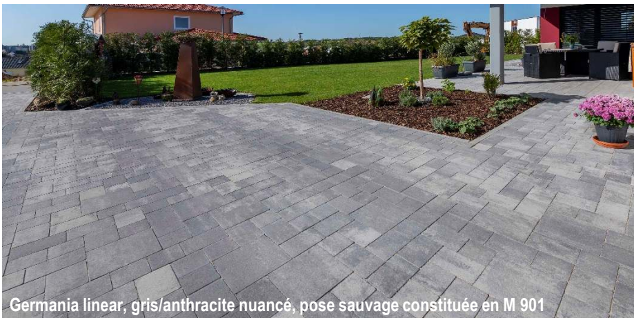
Germania linear, gris/anthracite nuancé, pose sauvage constituée en M 901