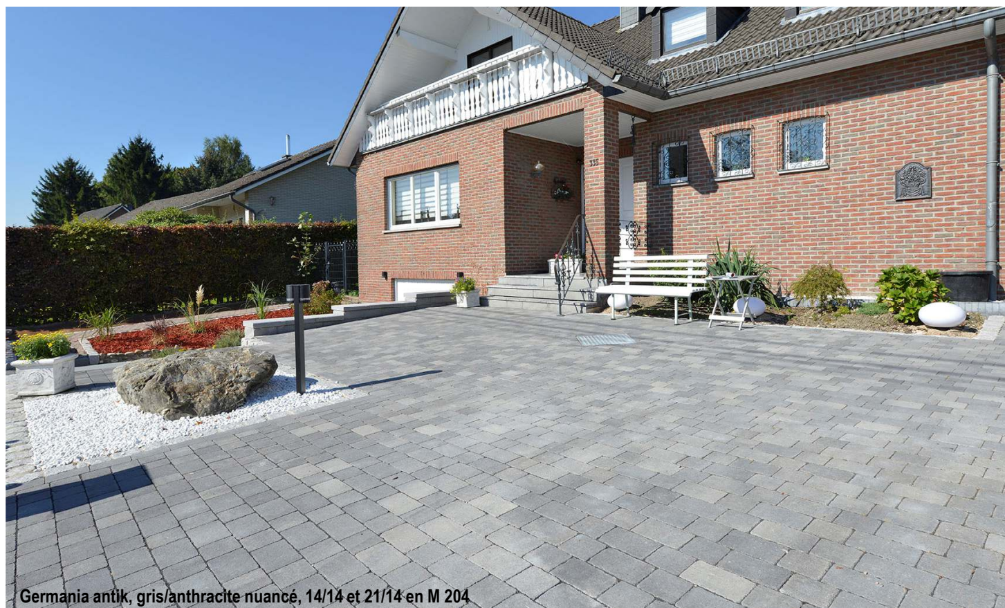
Germania antik, gris/anthracite nuancé, 14/14 et 21/14 en M 204