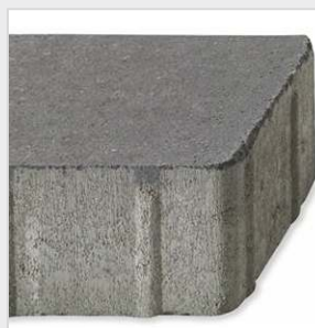
Pavé vieilli, arêtes brisées