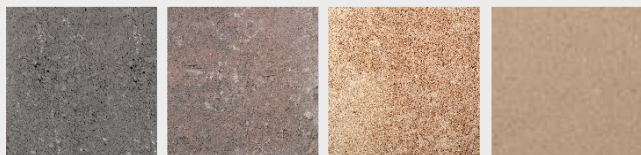
Anthracite Rouge/anthracite nuancé Grès Beige