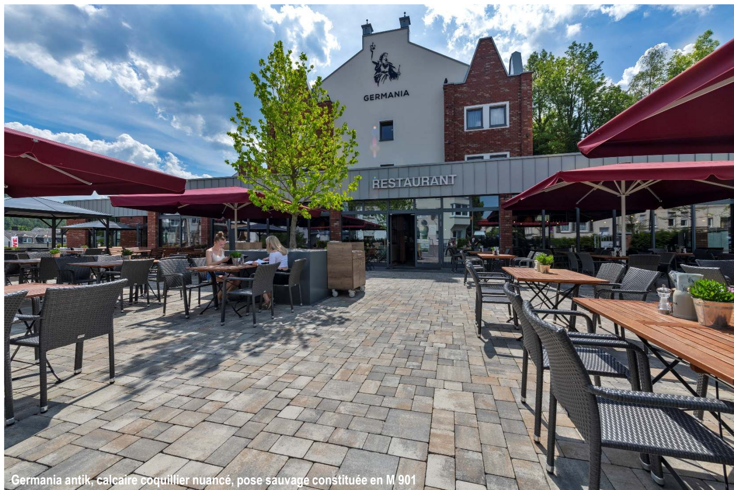
Germania antik, calcaire coquillier nuancé, pose sauvage constituée en M 901