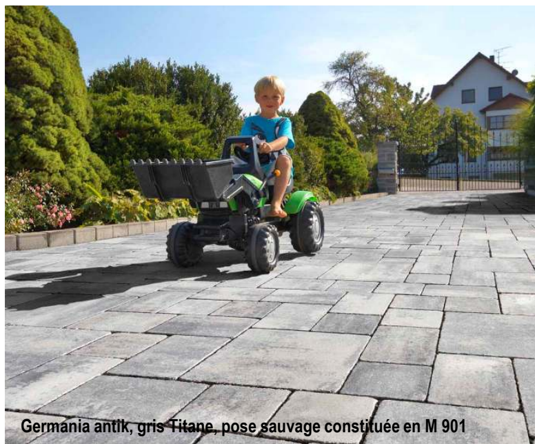
Germania antik, gris Titane, pose sauvage constituée en M 901

Pavé Germania antik, un revêtement à l'aspect vieilli pour les ouvrages naturels. La solution idéale pour des contrastes surprenants entre tradition et modernité.