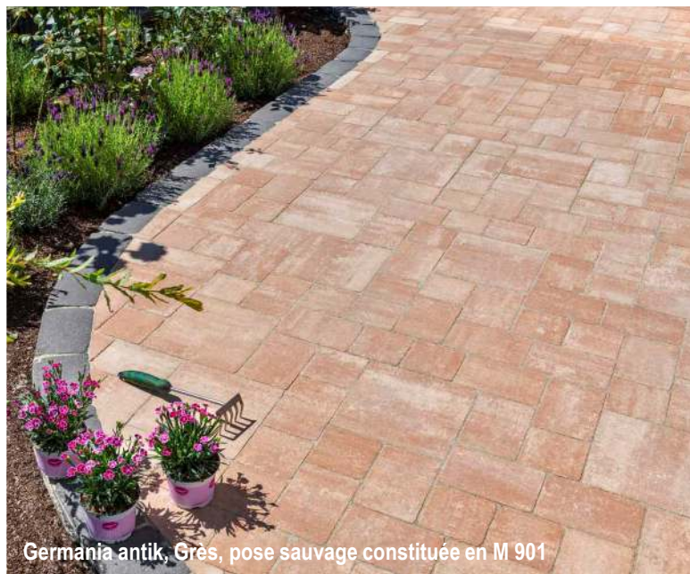
Germania antik, Grès, pose sauvage constituée en M 901