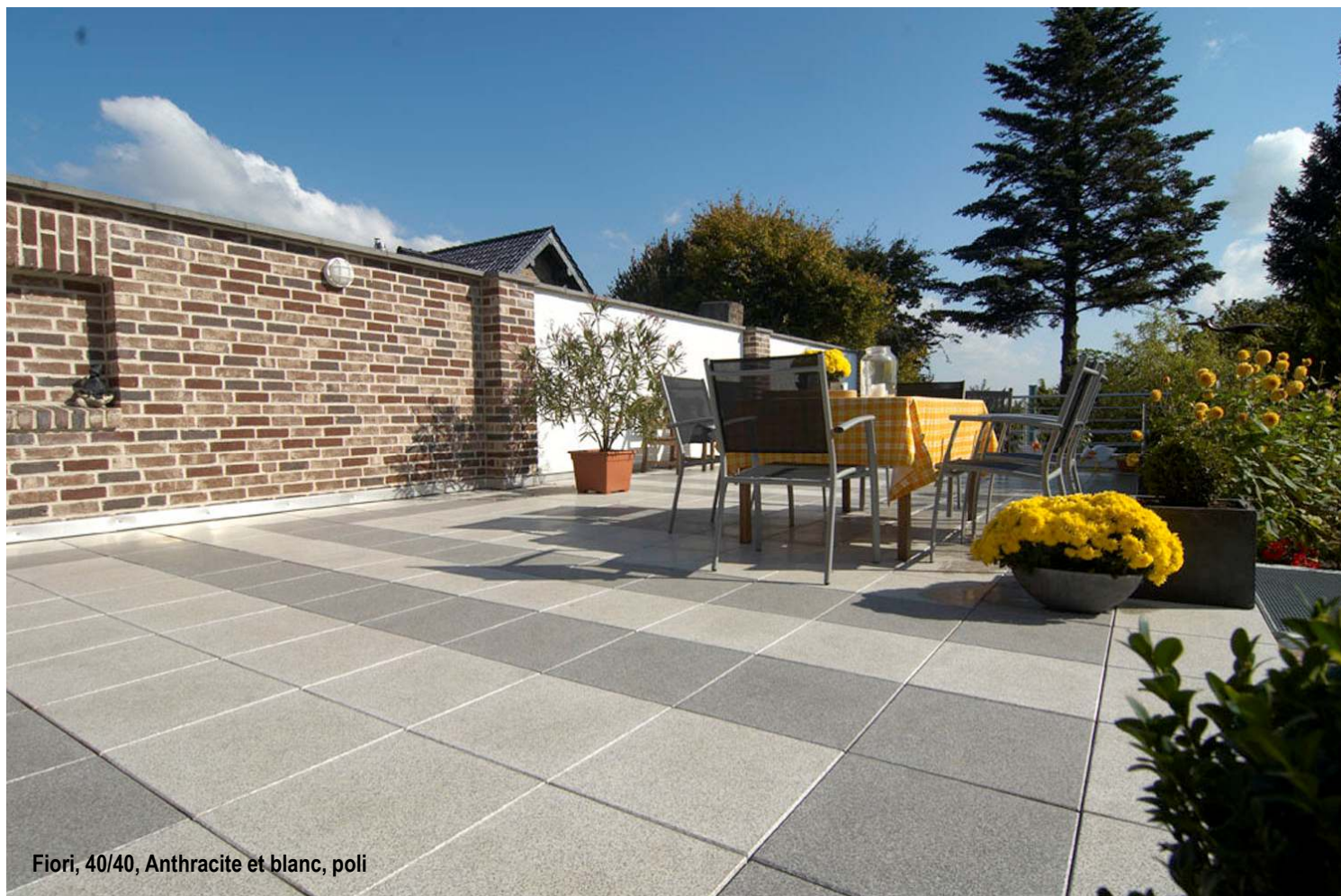
Fiori, 40/40, Anthracite et blanc, poli