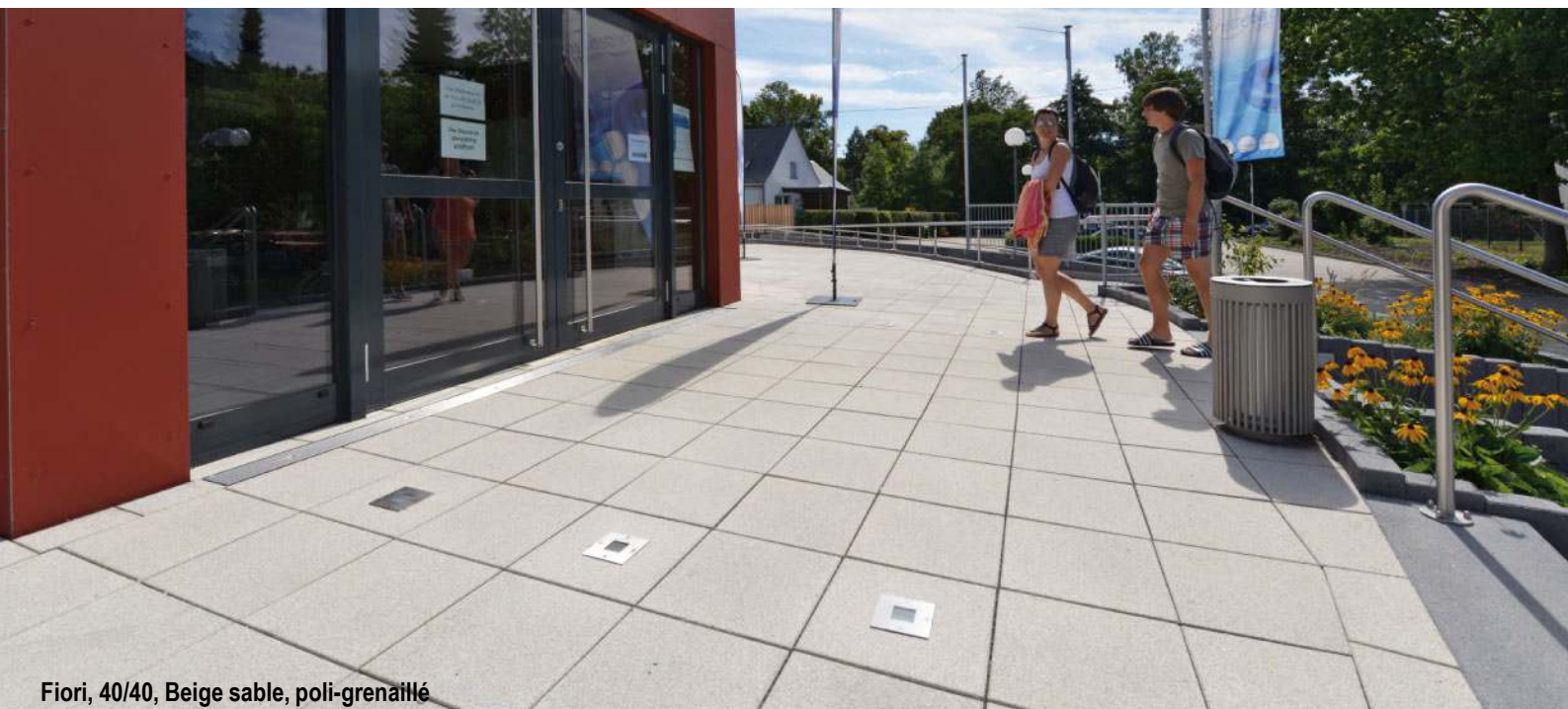
Fiori, 40/40, Beige sable, poli-grenailé

Les incrustations de pierres naturelles animent l'effet des dalles Fiori. Proposé en version polie ou en poli-grenailé, le revêtement est d'une extrême finesse, tout en assurant une accroche assurée. La variété des formats, dont la nouvelle version en 80x40 apporte des possibilités multiples de combinaisons.