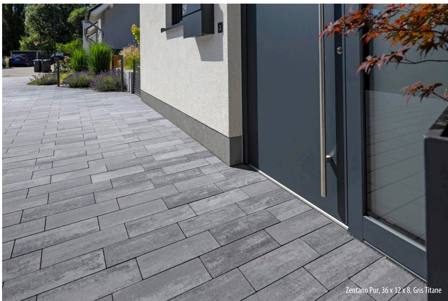
Zentano Pur, 36 x 12 x 8, Gris Titane