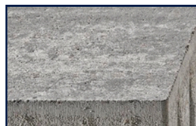
Revêtement béton lisse, arêtes vives, KannTec 12