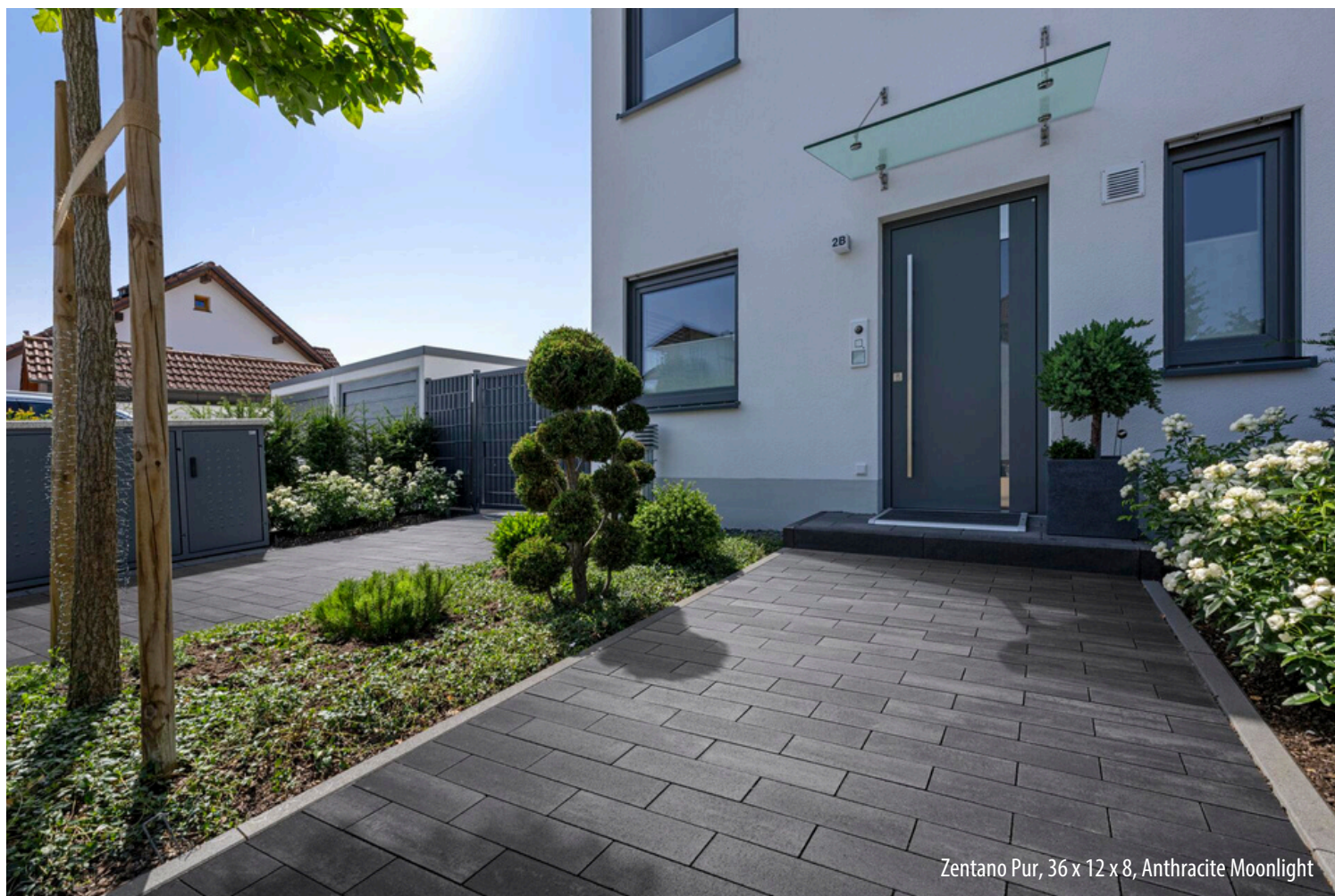
Zentano Pur, 36 x 12 x 8, Anthracite Moonlight