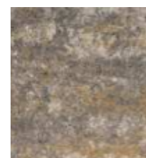
Calcaire coquiller nuancé