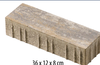
36 x 12 x 8 cm