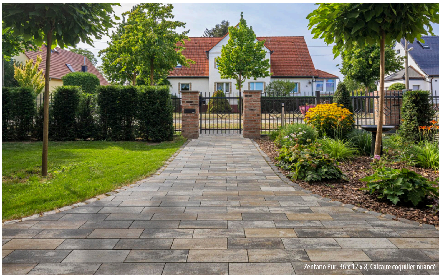
Zentano Pur, 36 x 12 x 8, Calcaire coquiller nuancé