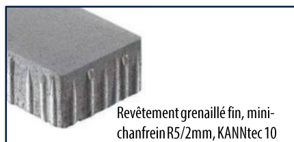
Revêtement grenaillé fin, mini-chanfrein R5/2mm, KANNtec 10