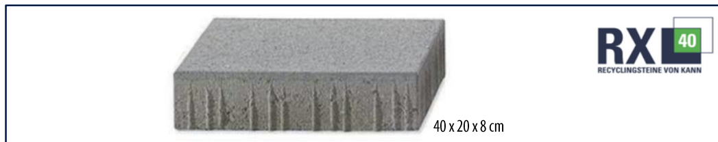
40 x 20 x 8 cm