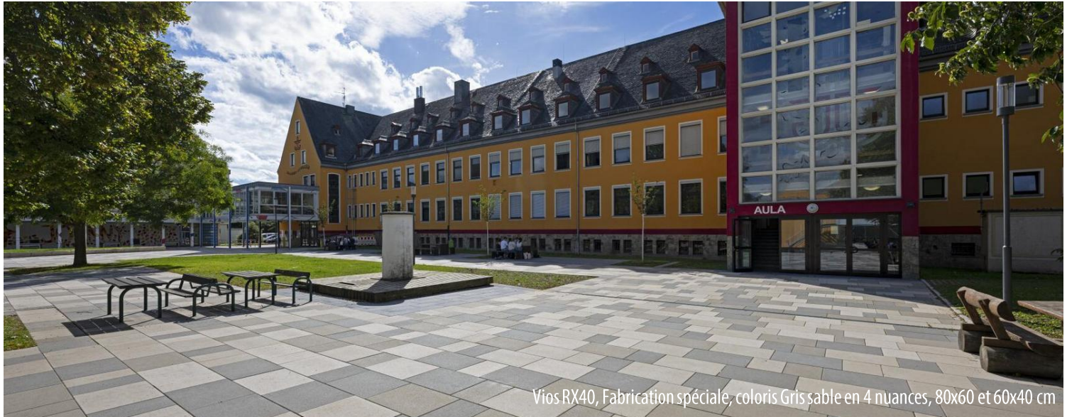
Vios RX40, Fabrication spéciale, coloris Gris sable en 4 nuances, 80x60 et 60x40 cm