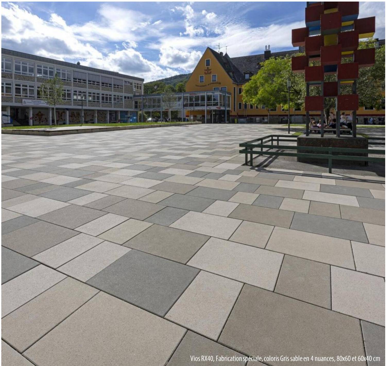
Vios RX40, Fabrication spéciale, coloris Gris sable en 4 nuances, 80x60 et 60x40 cm