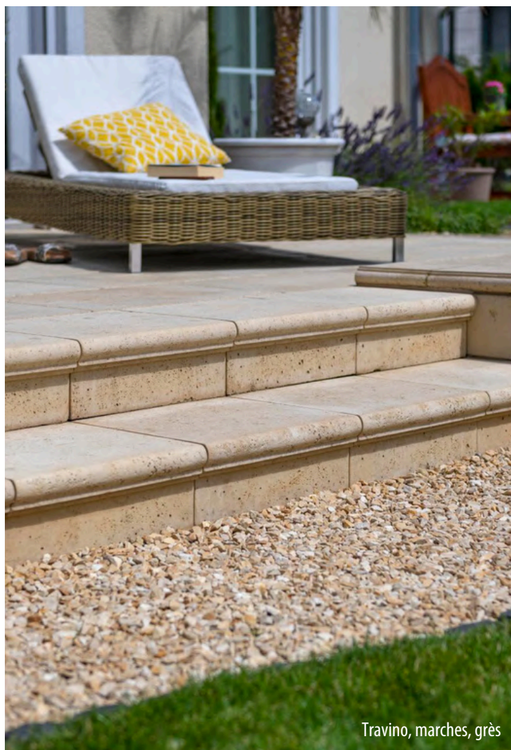
Travino, marches, grès