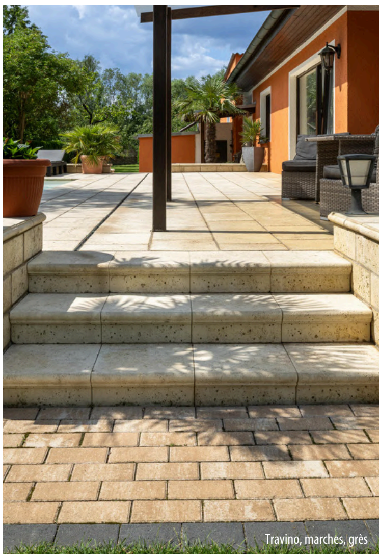
Travino, marches, grès