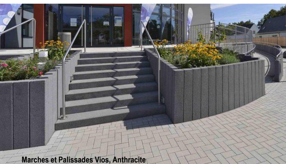
Marches et Palissades Vios, Anthracite