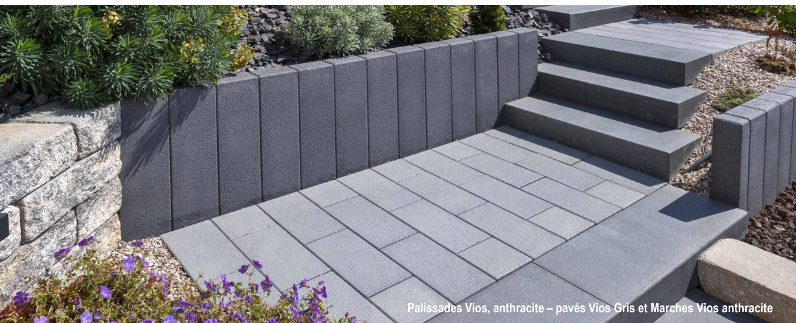
Palissades Vios, anthracite – pavés Vios Gris et Marches Vios anthracite