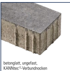
betonglatt, ungefast, KANNtec 12 -Verbundnocken