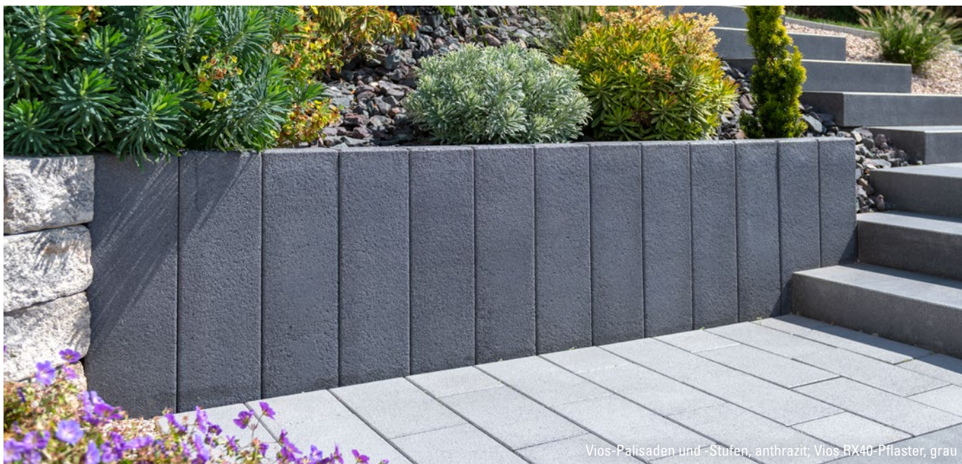
Vios-Palisaden und -Stufen, anthrazit; Vios RX40-Pflaster, grau