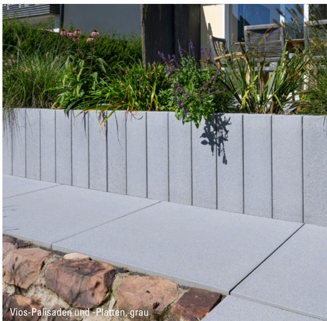
Vios-Palisaden und -Platten, grau