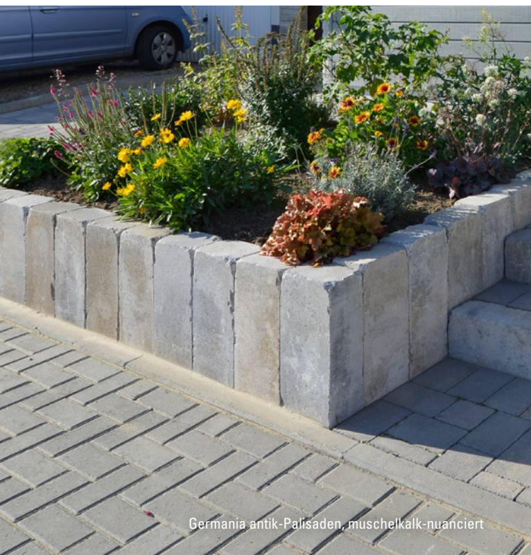
Germania antik-Palisaden, muschelkalk-nuanciert