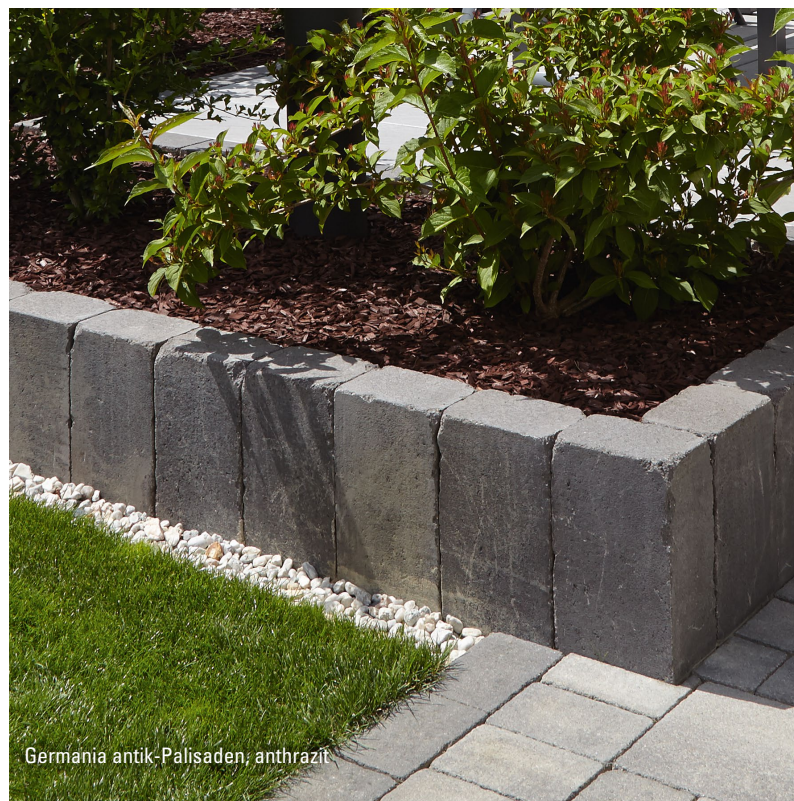
Germania antik-Palisaden, anthrazit