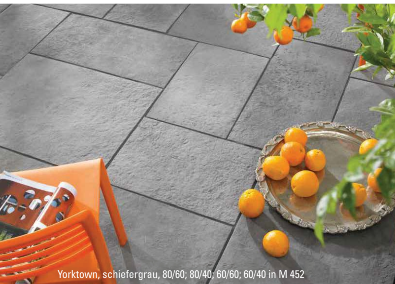
Yorktown, schiefergrau, 80/60; 80/40; 60/60; 60/40 in M 452