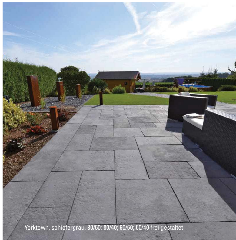
Yorktown, schiefergrau, 80/60; 80/40; 60/60; 60/40 frei gestaltet