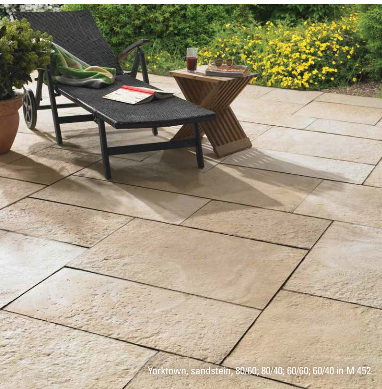
Yorktown, sandstein, 80/60; 80/40; 60/60; 60/40 in M 452