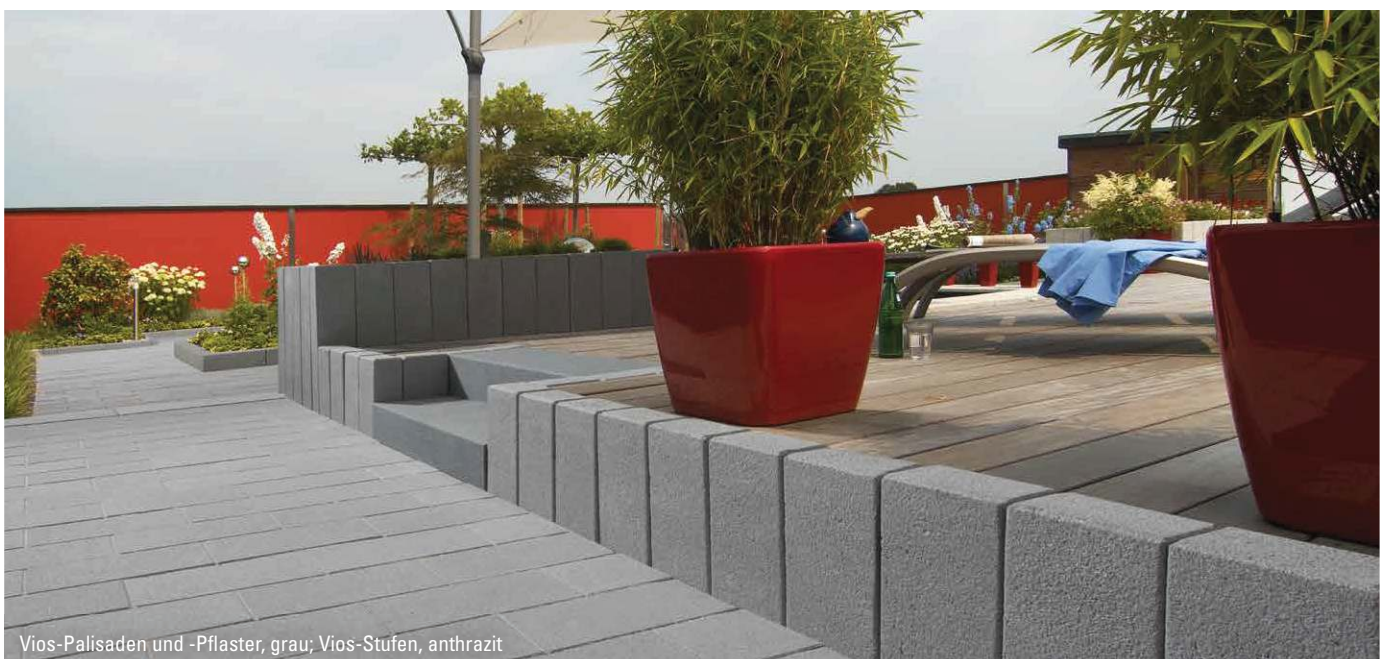
Vios-Palisaden und -Pflaster, grau; Vios-Stufen, anthrazit