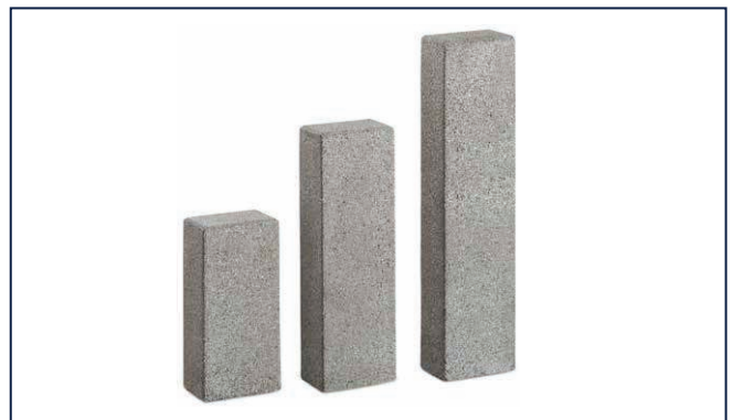
MultiPoller MultiBlock S. 334-337