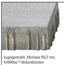
kugeligestrahlt, Minifase R5/2 mm, KANNtec 10 -Verbundnocken