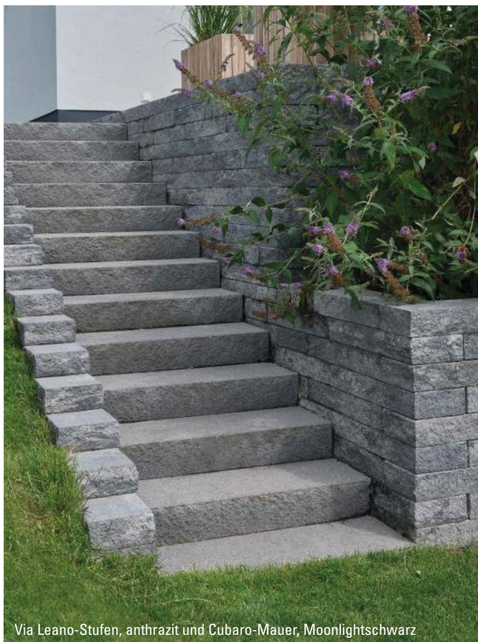
Via Leano-Stufen, anthrazit und Cubaro-Mauer, Moonlightschwarz