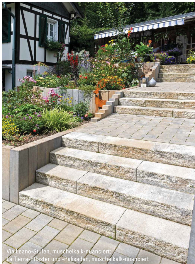
Via Leano-Stufen, muschelkalk-nuanciert; La Tierra-Pflaster und -Palisaden, muschelkalk-nuanciert