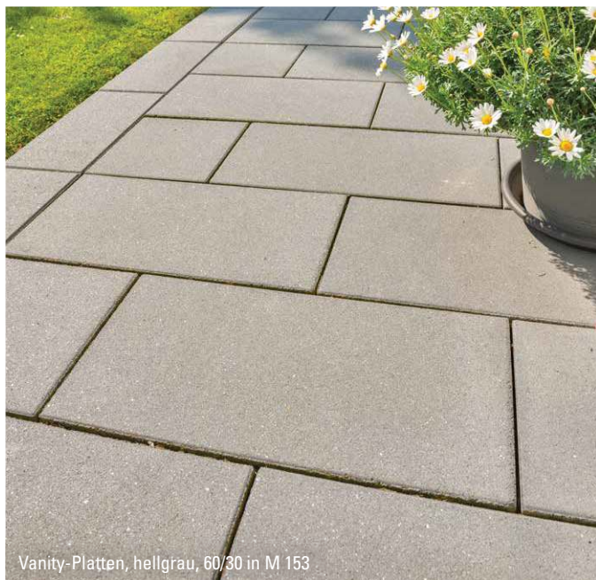
Vanity-Platten, hellgrau, 60/30 in M 153