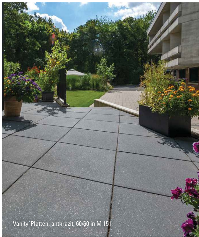
Vanity-Platten, anthrazit, 60/60 in M 151