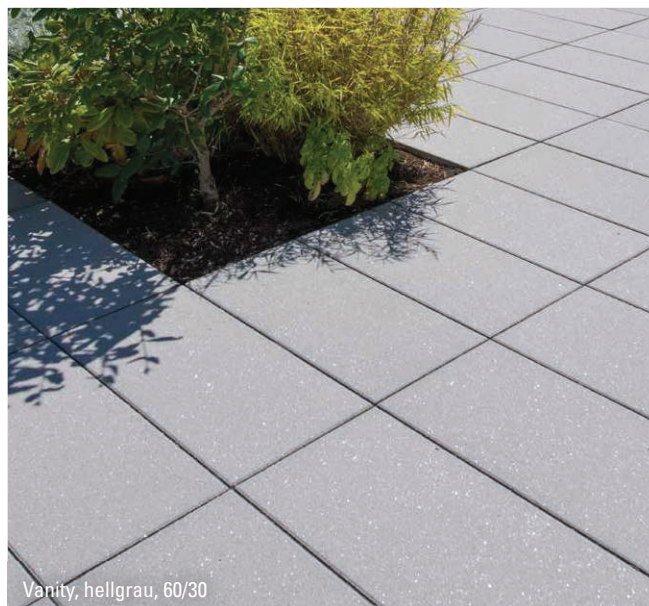
Vanity, hellgrau, 60/30