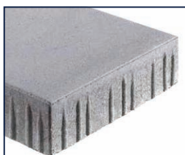
satiniert, Minifase R5/2 mm, KANNtec 10 -Verbundnocken