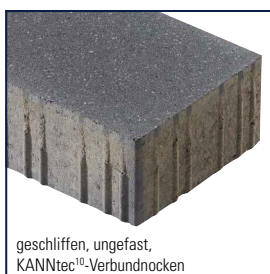
geschliffen, ungefast, KANNtec 10 -Verbundnocken