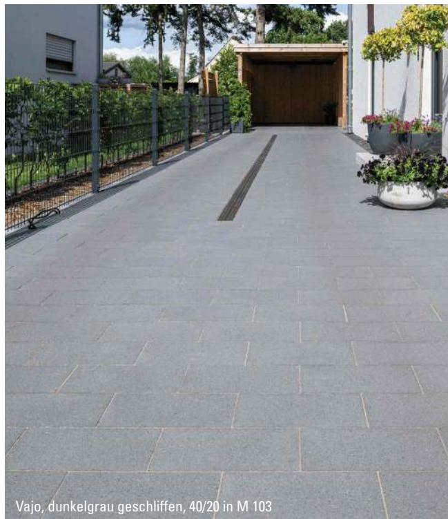
Vajo, dunkelgrau geschliffen, 40/20 in M 103