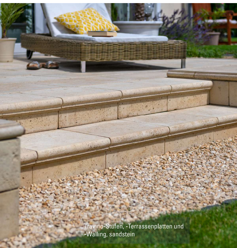
Travino-Stufen, -Terrassenplatten und -Walling, sandstein