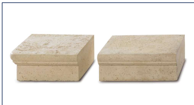
Mauern S. 302–303