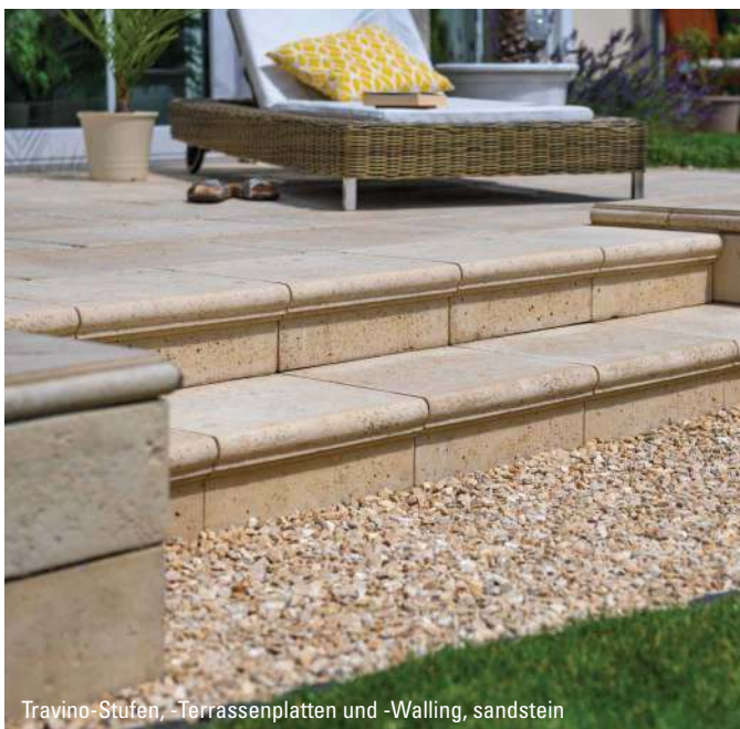
Travino-Stufen, -Terrassenplatten und -Walling, sandstein