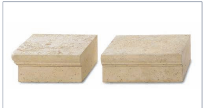
Mauern S. 304–305