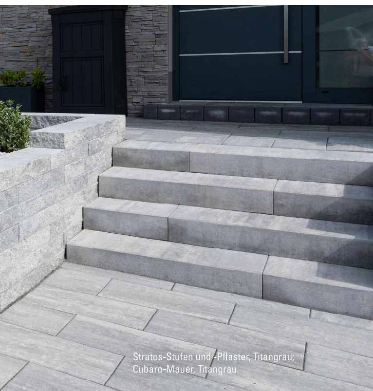
Stratos-Stufen und -Pflaster, Titangrau; Cubaro-Mauer, Titangrau