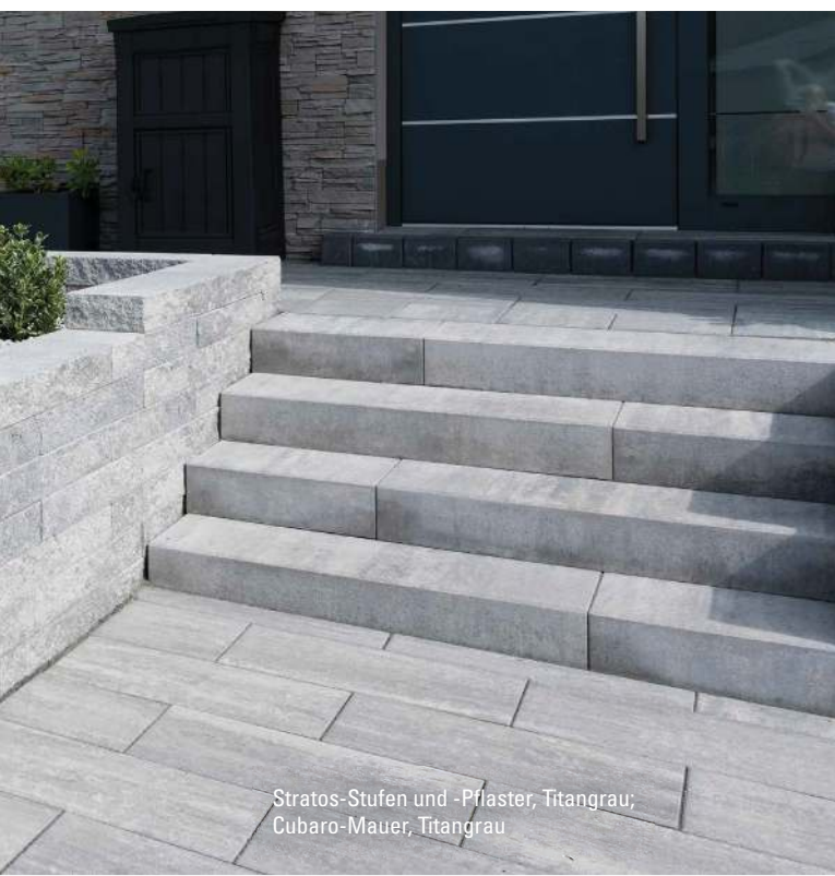
Stratos-Stufen und -Pflaster, Titangrau; Cubaro-Mauer, Titangrau