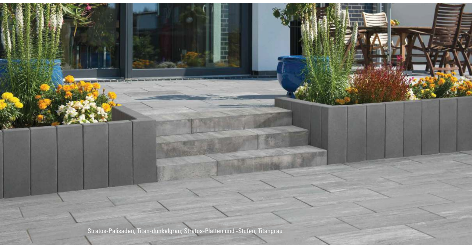
Stratos-Palisaden, Titan-dunkelgrau; Stratos-Platten und -Stufen, Titangrau