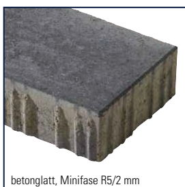
betonglatt, Minifase R5/2 mm