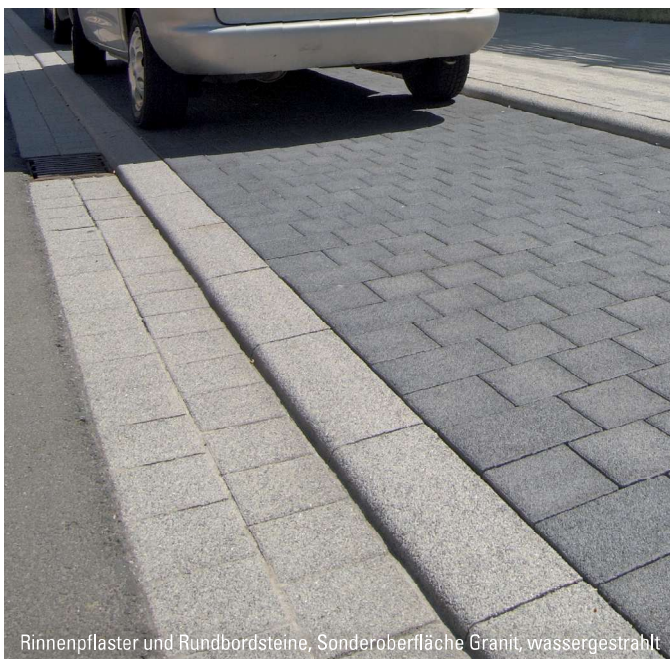
Rinnenpflaster und Rundbordsteine, Sonderoberfläche Granit, wassergestrahlt

1) Nur in der Lieferregion West erhältlich.