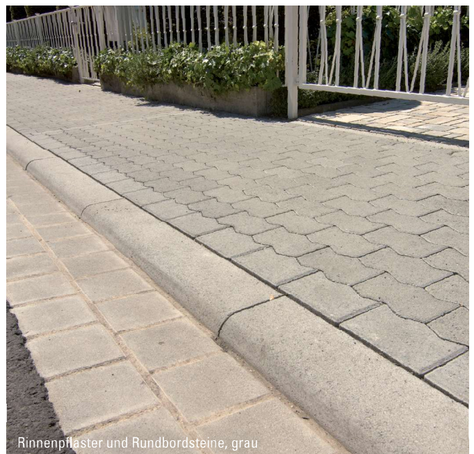
Rinnenpflaster und Rundbordsteine, grau