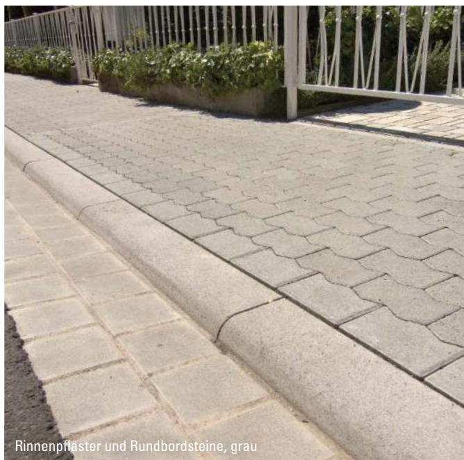
Rinnenpflaster und Rundbordsteine, grau