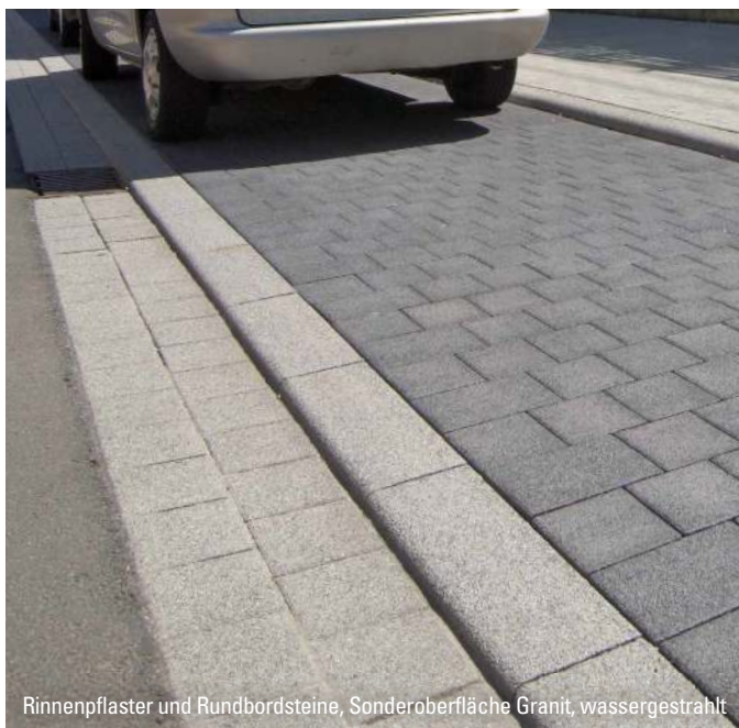
Rinnenpflaster und Rundbordsteine, Sonderoberfläche Granit, wassergestrahlt

1) Nur in der Lieferregion West erhältlich.