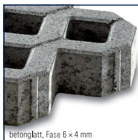
betonglatt, Fase 6 × 4 mm