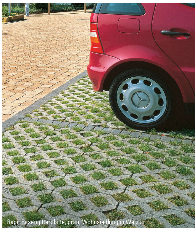
Ragit Rasengitterplatte, grau, Wohnsiedlung in Wetzlar