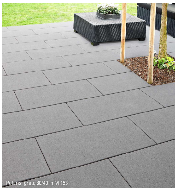
Polaris, grau, 80/40 in M 153