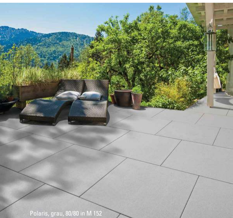
Polaris, grau, 80/80 in M 152