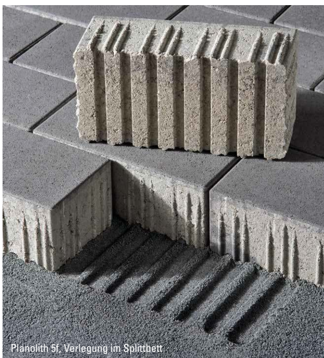
Planolith 5f, Verlegung im Splittbett

Planolith 5f ist nur in den Lieferregionen Nord, Ost und West erhältlich.