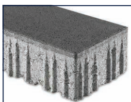
wassergestrahlt, Minifase R5/2 mm, KANNtec 16 -Verbundnocken