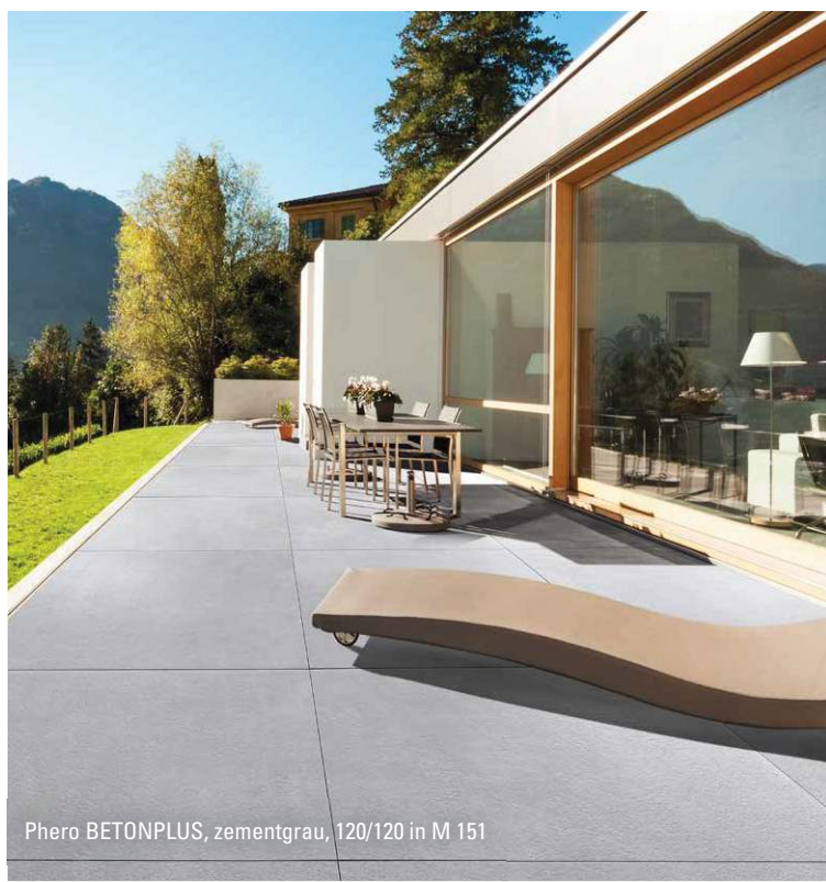
Phero BETONPLUS, zementgrau, 120/120 in M 151