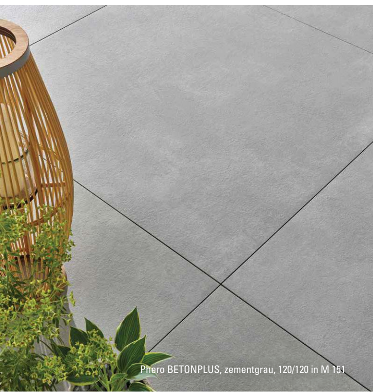
Phero BETONPLUS, zementgrau, 120/120 in M 151

Der Zuschnitt von großformatigen Phero BETONPLUS-Platten lässt sich sehr präzise mit einem Diamant Steintrenner ausführen, der wie eine Handkreissäge an einer Führungsschiene geführt wird (zum Beispiel Marcris STC185 SMAX; FLEX CS 60 WET). Feine Kantenausbrüche nach dem Schneiden können mit Trockenschleifpads ausgeschliffen bzw. kaschiert werden.