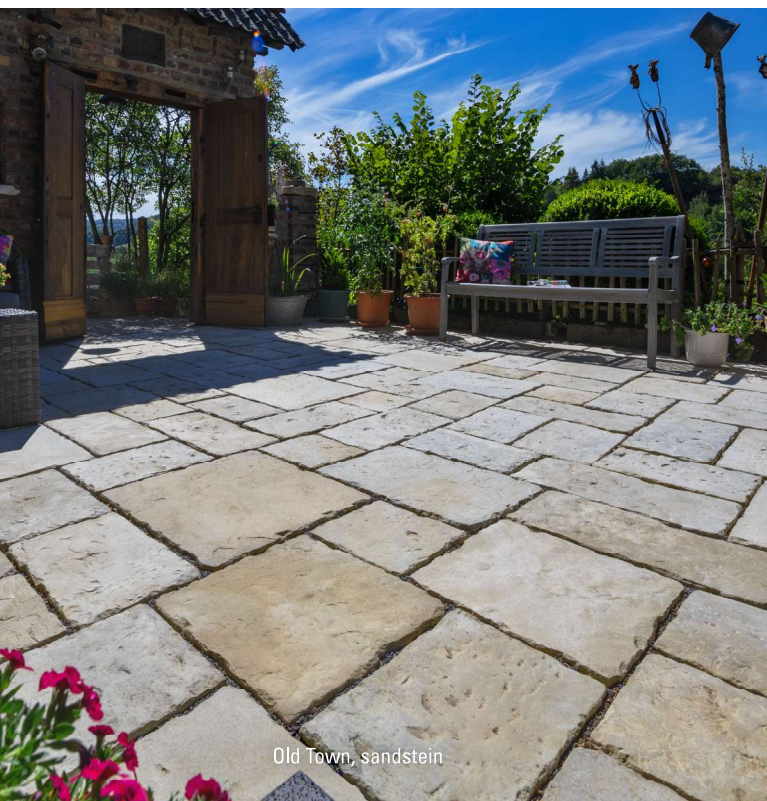
Old Town, sandstein

* Die Lieferung erfolgt in ganzen Paketen, in denen die jeweiligen Formate in den angegebenen Mengen vorhanden sind.