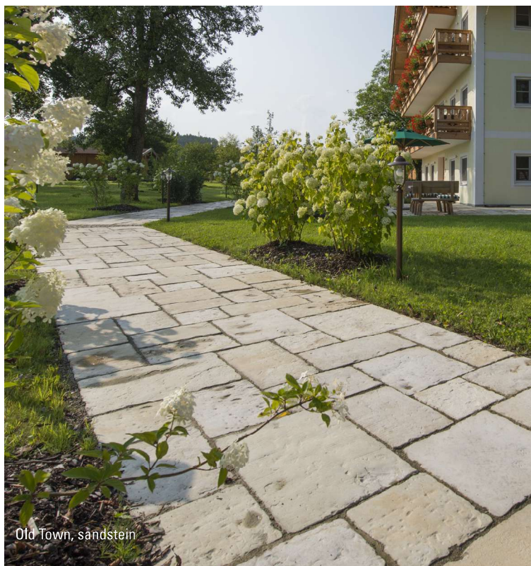
Old Town, sandstein