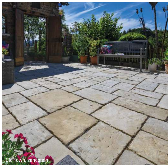
Old Town, sandstein

* Die Lieferung erfolgt in ganzen Paketen, in denen die jeweiligen Formate in den angegebenen Mengen vorhanden sind.