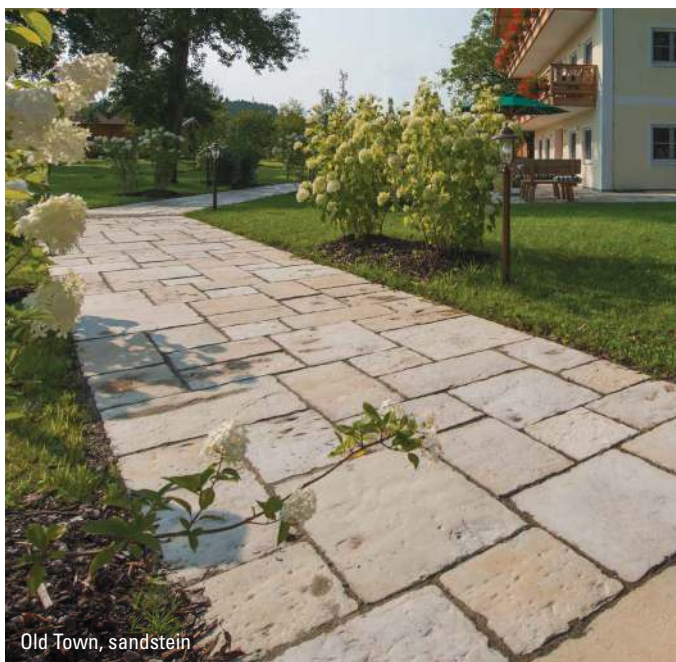
Old Town, sandstein