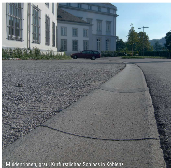
Muldenrinnen, grau, Kurfürstliches Schloss in Koblenz