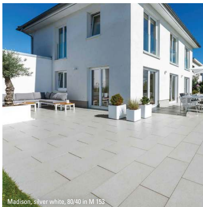
Madison, silver white, 80/40 in M 153