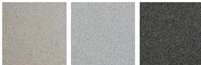
silver white a)