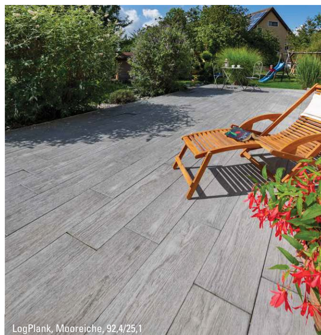
LogPlank, Mooreiche, 92,4/25,1