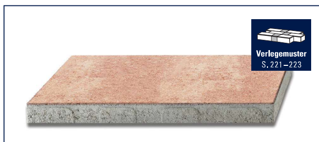
Verlegemuster S. 221–223