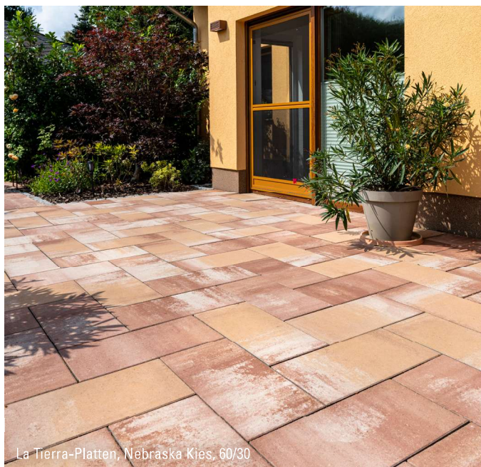
La Tierra-Platten, Nebraska Kies, 60/30