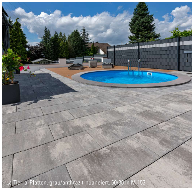
La Tierra-Platten, grau/anthrazit-nuanciert, 60/30 in M 153