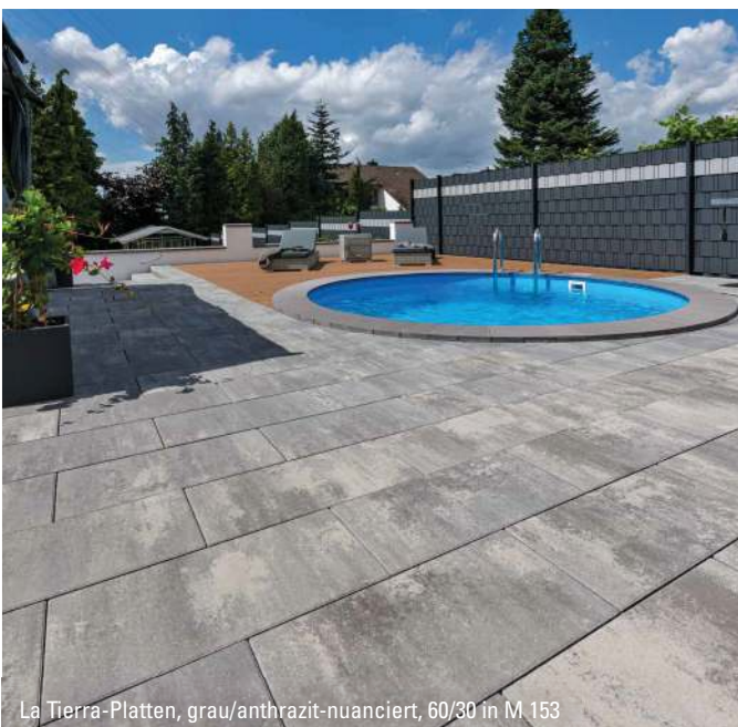
La Tierra-Platten, grau/anthrazit-nuanciert, 60/30 in M 153