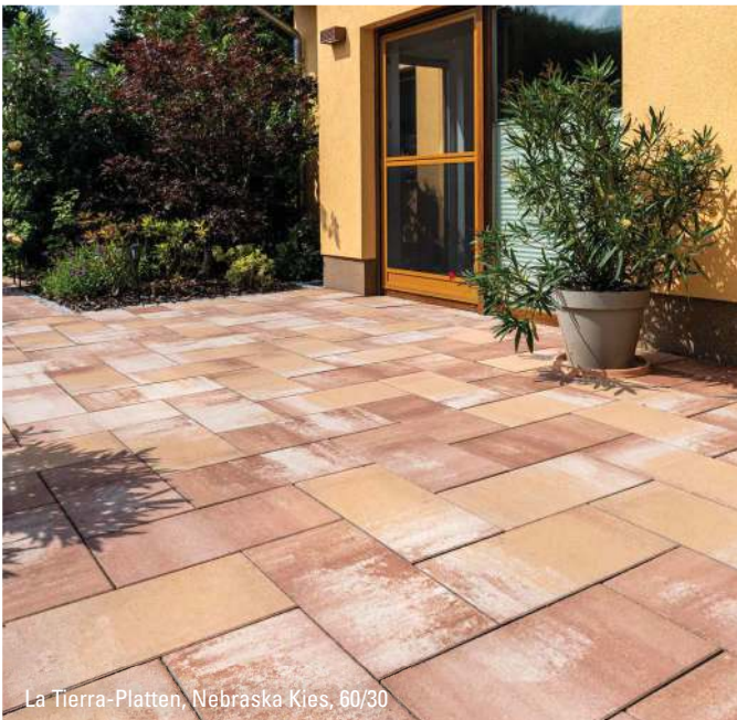
La Tierra-Platten, Nebraska Kies, 60/30