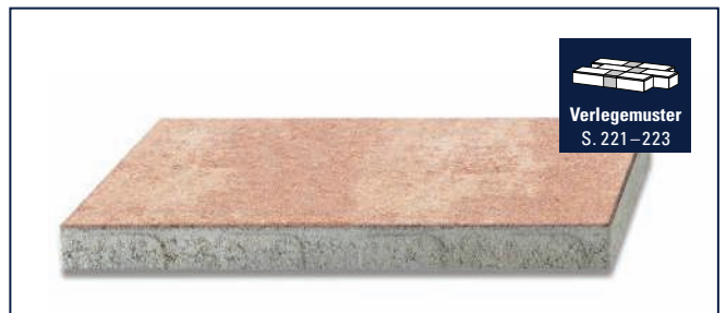
Verlegemuster S. 221–223