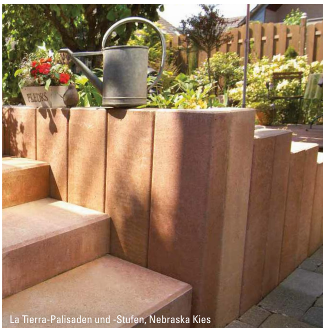
La Tierra-Palisaden und -Stufen, Nebraska Kies