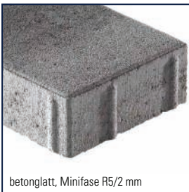
betonglatt, Minifase R5/2 mm