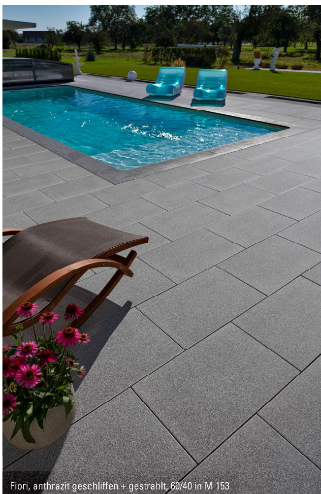
Fiori, anthrazit geschliffen + gestrahlt, 60/40 in M 153