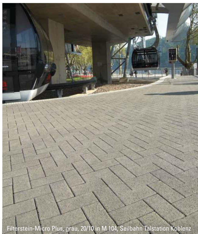
Filterstein-Micro Plus, grau, 20/10 in M 104, Seilbahn Talstation Koblenz

Nur in der Lieferregion West erhältlich.