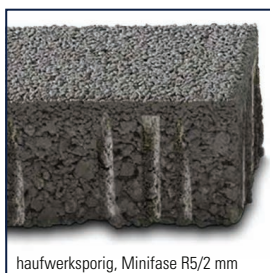
haufwerksporig, Minifase R5/2 mm