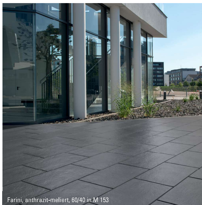
Farini, anthrazit-meliert, 60/40 in M 153