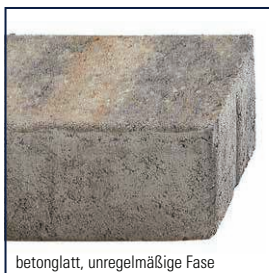
betonglatt, unregelmäßige Fäse

Burgpflaster ist nur in den Lieferregionen Nord und Ost erhältlich.