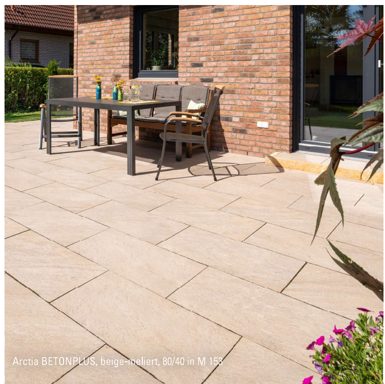
Arctia BETONPLUS, beige-meliert, 80/40 in M 153